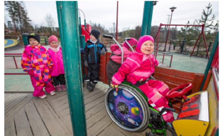
ESPOON KAUPUNGIN VAMMAIASIAMIEHEN SELVITYS VUODELTA 2017